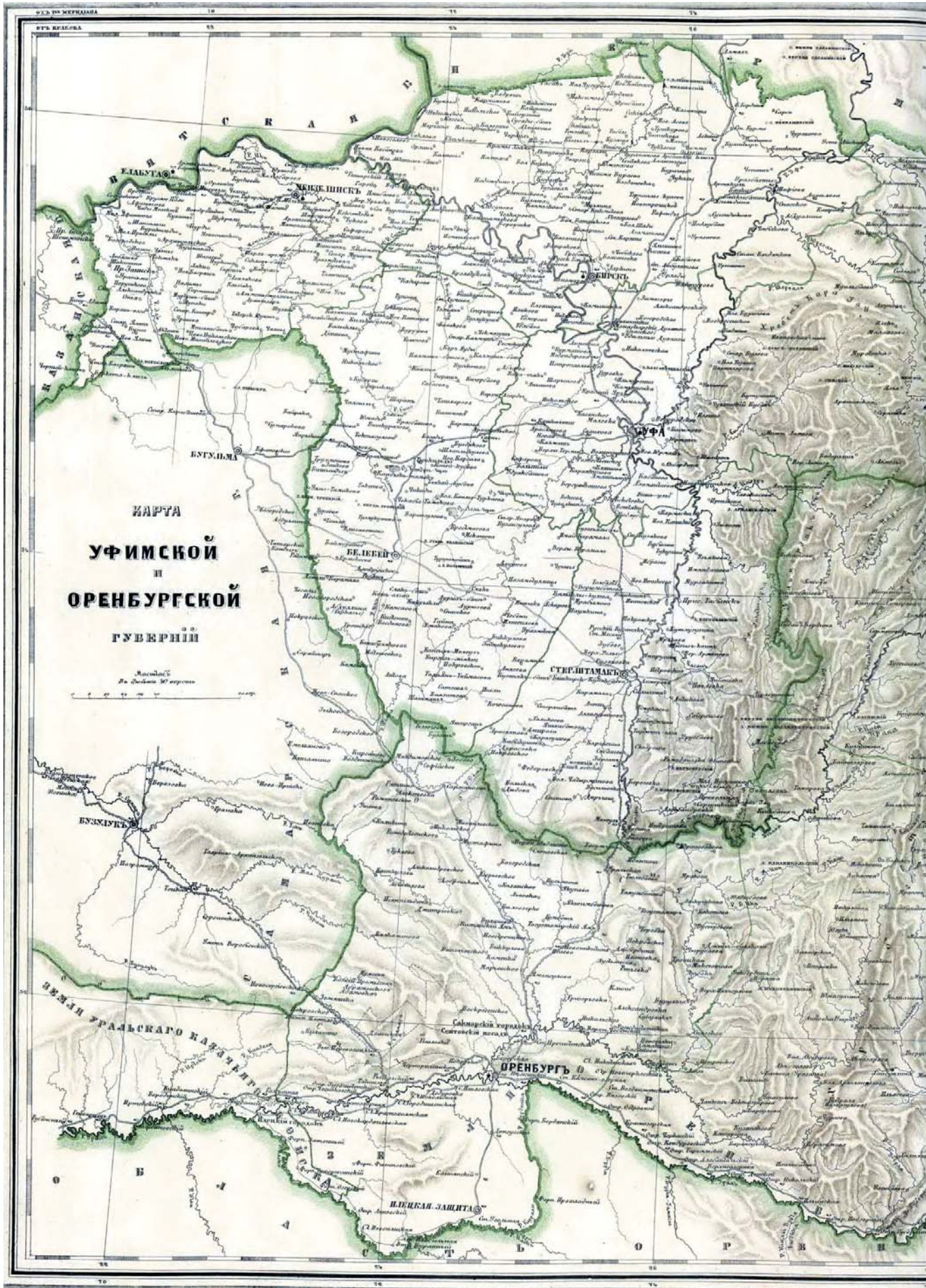
Карта Уфимской и Оренбургской губерний, с планами Уфы и Оренбурга.